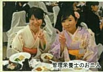
管理栄養士のお二人