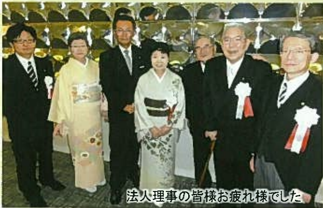
法人理事の皆様お疲れ様でした