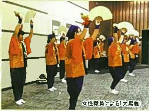
女性職員による「大黒舞」