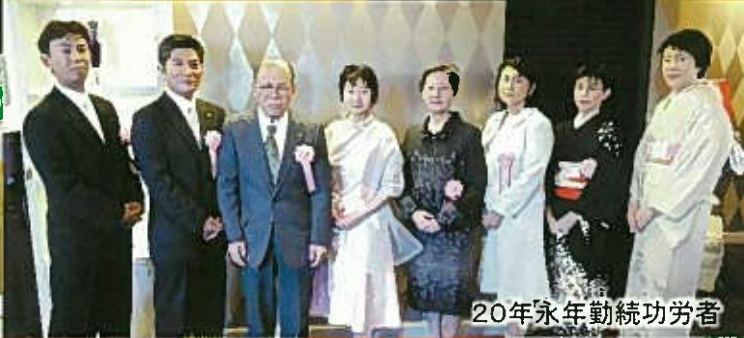
20年永年勤続功労者