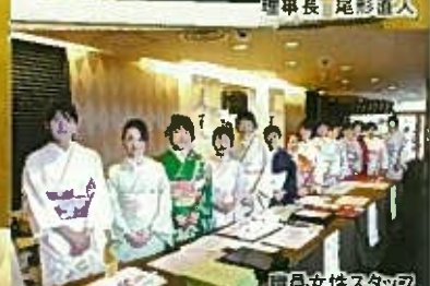
職員女性スタッフ