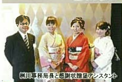
科川事務局長と感謝状贈呈アシスタント