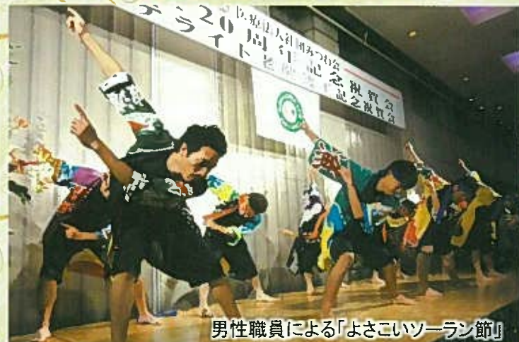
男性職員による「よさこいソーラン節」