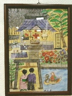
荘内神社を題材にした絵