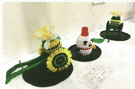
ペーパーブロックのかわいらしい作品