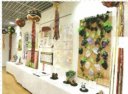
みつわ会の展示スペース