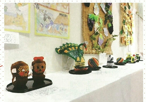
ペーパーブロックのかわいらしい作品